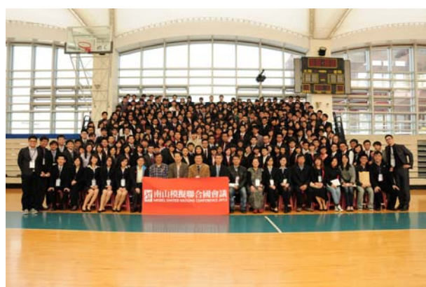
2013 南山模擬聯合國會議(兩岸三地計 39 校參加)