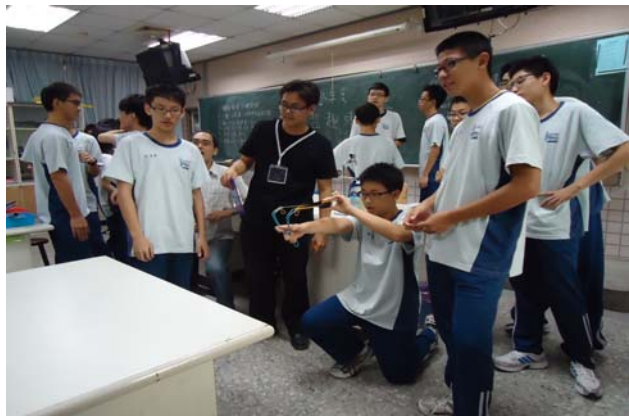
遠哲趣味競賽教學