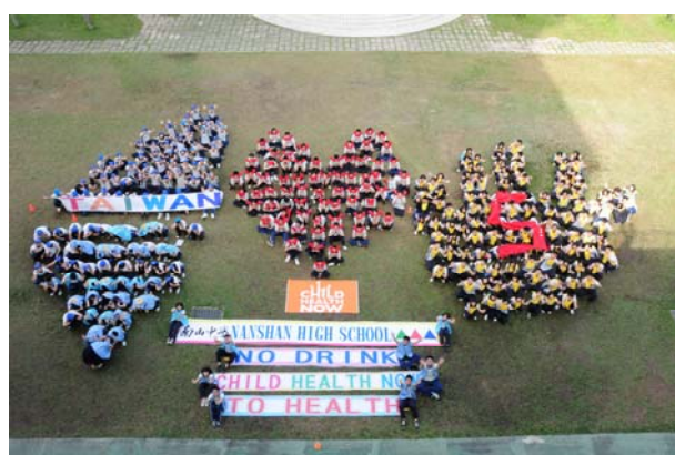
「飢不可食、無飲料日」共同守護兒童活動