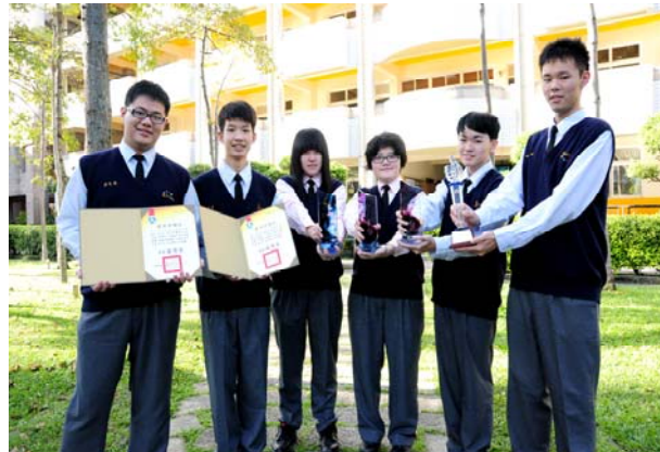
全國技藝競賽榮獲 3 金手 3 優勝