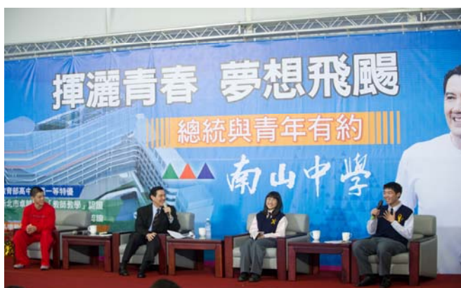
「總統與青年有約」總統至本校與學生座談