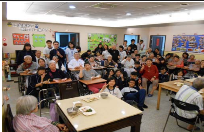
學生校外服務學習